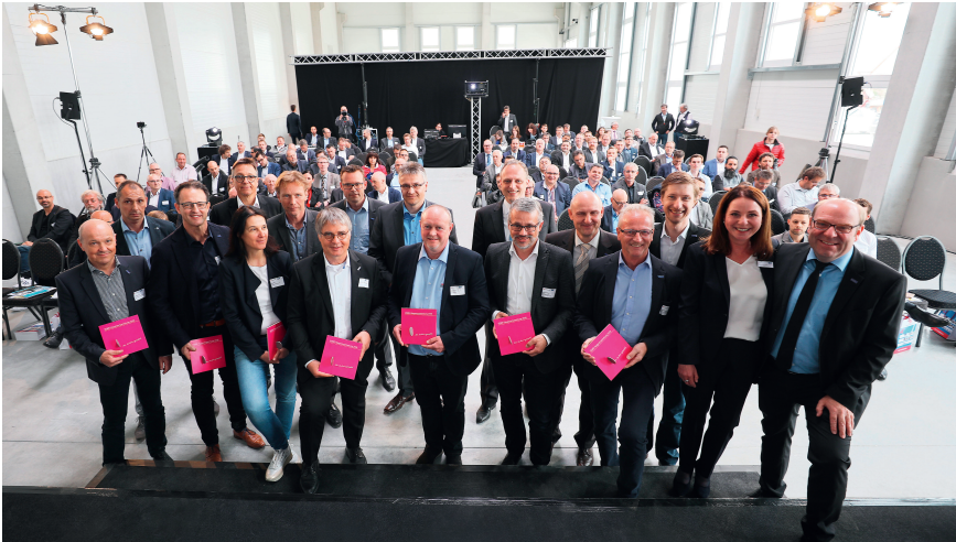
Jahreshauptversammlung: Die mittlerweile 340 Mitglieder des VDWF treffen sich am II. April bei Makino in Kirchheim unter Teck.